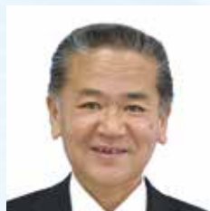
八代港ポートセールス 協議会会長(八代市長) 中村 博生