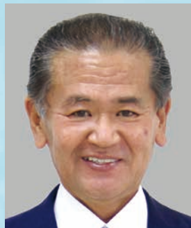
八代港ポートセールス 協議会会長(八代市長) 中村 博生