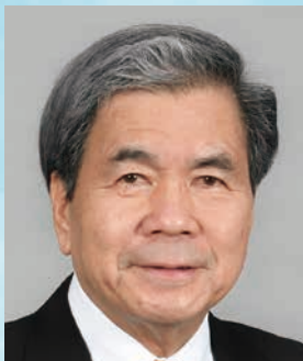
熊本県知事 蒲島 郁夫