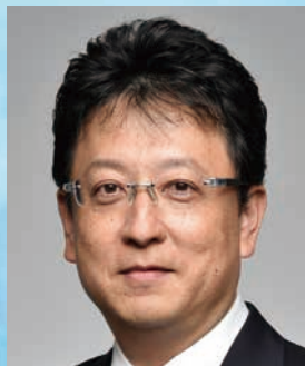
熊本港ポートセールス 協議会会長(熊本市長) 大西 一史